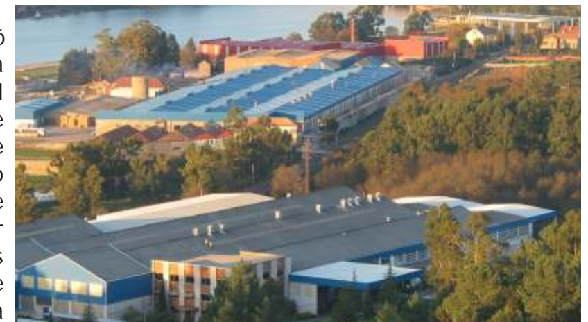
Vista empresas de Catoira

Todas estas renuncias supóñenlle ó Concello uns 70 millóns. Para facernos unha idea, cada metro lineal de alcantarillado custa entre 10.000 e 15.000 pesetas, pois cos cartos que perde o concello por este acordo faríanse aproximadamente 6 kms de alcantarillado, que suporían arranxar unha das grandes demandas dos veciños e veciñas de Catoira, sen que repercutise negativamente na construción do Parque.