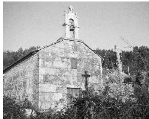
Capela de San Nicolau (Meis)

Os ataques sistemáticos contra o noso patrimonio seguen a producirse; como exemplo a destrución dos cruceiros do Agrelo (Zacande-Nogueira) ou os danos sufridos polo cruceiro de Quintáns (San Salvador de Meis). O PP non quixo discutir a moción que levou o BNG.