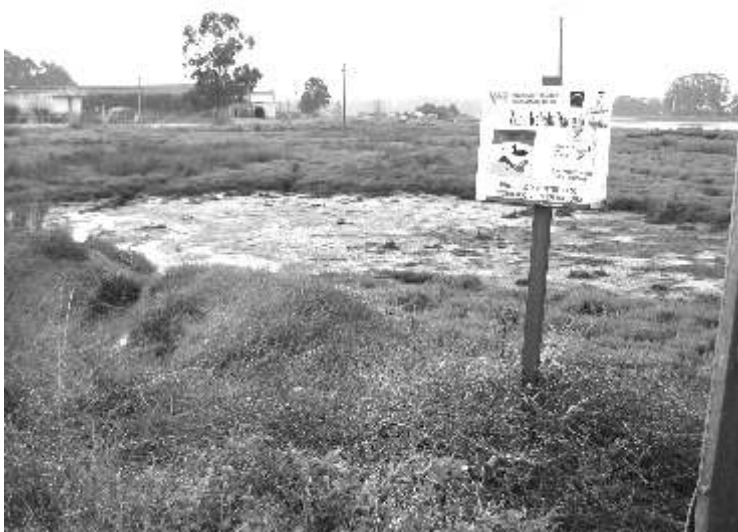
VERTIDO NA DESEMBOCADURA DO UMIA

A gravidade da situación require que se tomen xa, de xeito urxente, medidas correctoras por parte, tanto da administración municipal, coma da autonómica.